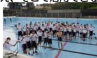
プール清掃頑張りました。

この夏は自分の目標に向かって、いろいろな経験を積み、家庭学習・部活動・地域でのボランティア等を通して、コミュニケーション能力をはじめ、「様々な力を身に付ける時間」にしてほしいです。9月1日に「最高に充実した夏休みだった」という、笑顔を見せてください。