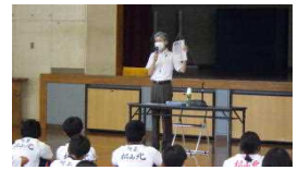
薬物乱用防止教室の様子

今回も、1年生は体育館で直接講師の先生の話の聞き、2年生・3年生は、カメラで撮った映像を中継で各教室に配信し、ライブ中継で行いました。