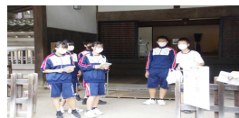
川越城跡 本丸御殿見学

7月14日(木)川越学習を行いました。来年の修学旅行に向け、班で協力して目的を達成するという、練習も兼ねていました。どの班も協力して行動できたようです。東上線の遅延というハプニングもありましたが、充実した1日を過ごせました。