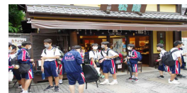
菓子屋横丁買い物・散策